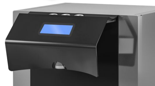
Erogazione elettrica predosaggio